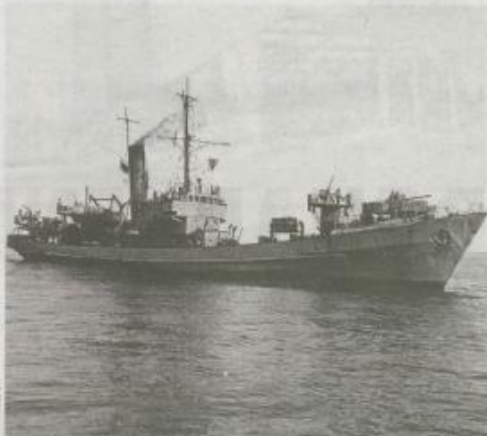
Le UJ-1420 est un chalutier construit en Hollande et armé par les Allemands pendant la Seconde Guerre mondiale, pour faire la chasse aux sous-marins.

L'Aseb, le club de plongée de Quimper, vient d'identifier l'épave d'un chasseur de sous-marins de la Seconde Guerre mondiale au large de Beg-Meil, à Fouesnant. L'UJ-1420 était supposé avoir coulé près de l'île de Groix (56).